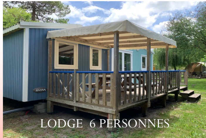
LODGE 6 PERSONNES